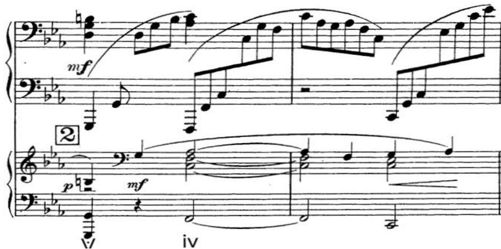
谱 13 拉赫玛尼诺夫《第二钢琴协奏曲》第一乐章 27-28 小节

如谱 12 所示, 122 小节的 VI_9-II_9-IV 的和声进行, 一般的九和弦需要解决到其上方纯四度的三和弦, 但这里并未到达其本期待的和弦而是继续其他的九和弦再到 IV 的一个大三和弦, 因此这个进行属于意外进行的范畴。